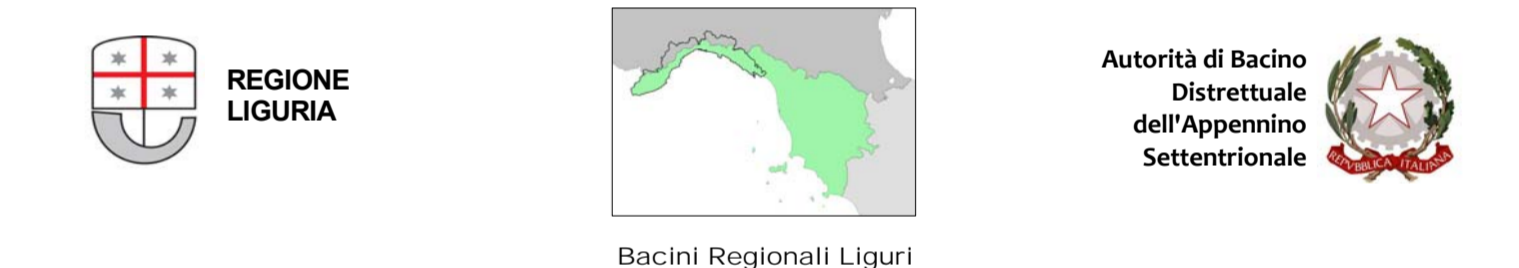
PIANO DI BACINO STRALCIO PER L'ASSETTO IDROGEOLOGICO AMBITO 16 - ENTELLA

Nota alla carta: La presente carta riporta l'ubicazione degli interventi descritti nel Piano; sebbene per alcuni di essi sia data una descrizione della tipologia si rimanda comunque al Piano degli Interventi.