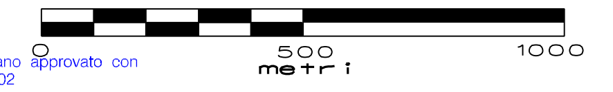
TAVOLA N. 1 CARTA DELL'ACCLIVITA' scala 1:10.000

Elaborato di anelli del Piano approvato con D.C.P. n. 68 del 12-12-2002