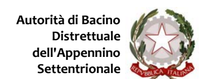
Bacini Regionali Liguri