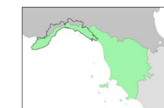
Bacini Regionali Liguri